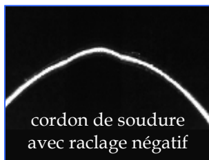
cordon de soudure avec raclage négatif