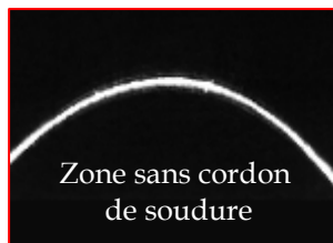
Zone sans cordon de soudure