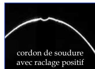
cordon de soudure avec raclage positif